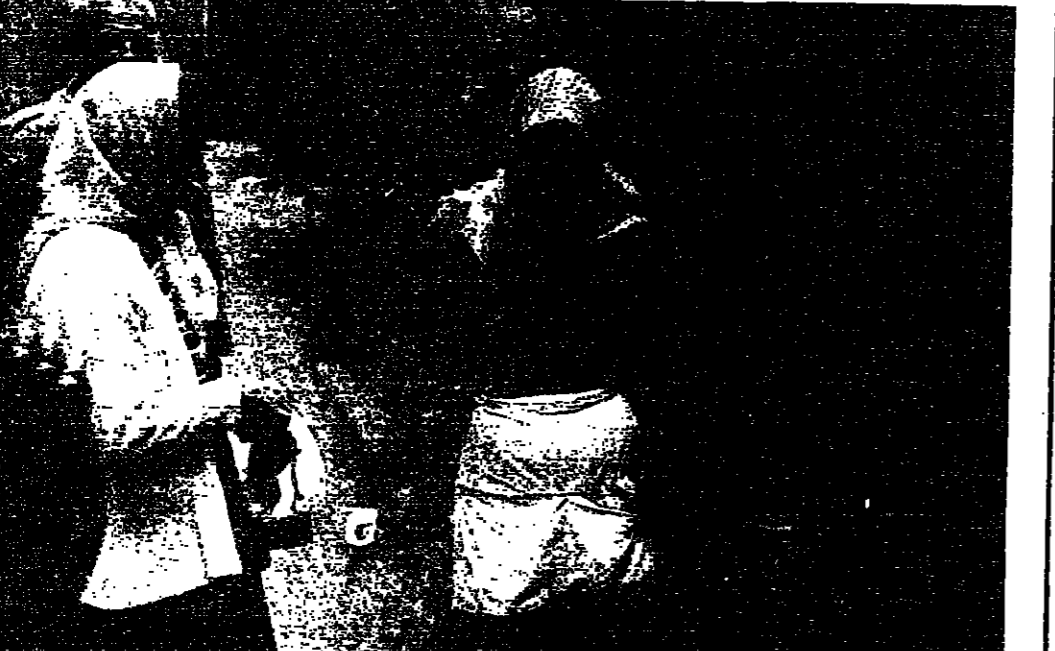
شيرة على التعل ضربة على السندان